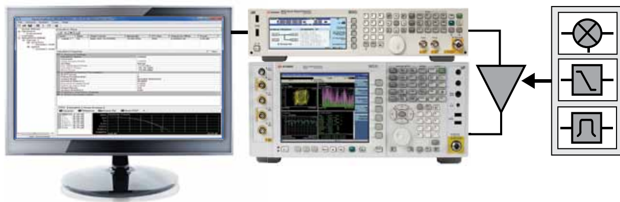
Рис. 1. Типовая схема тестирования, использующая базовые возможности Signal Studio с генератором и анализатором сигналов серии Keysight X.

Расширенные возможности ПО Signal Studio позволяют создавать и настраивать сигналы для измерения мощности и параметров модуляции передатчиков и их компонентов в соответствии со стандартами цифрового ТВ, включая DVB-T/H/T2/C/S/S2, ISDB-T/T B /T SB /Tmm, ATSC, ATSC-M/H, DTMB (СТТВ), CMMB, J.83 Приложение A/B/C и DOCSIS DS. Простая манипуляция различными параметрами сигнала, включая полосу передачи, циклический префикс и тип модуляции, упрощает создание сигналов.