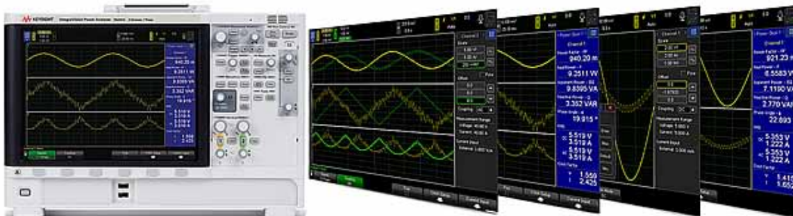
Рис. 1. Анализатор силовых цепей PA2201A IntegraVision с дисплеем 12,1 дюйма