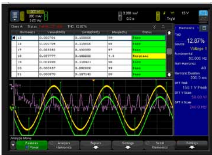
Рис. 2. Содержание гармоник