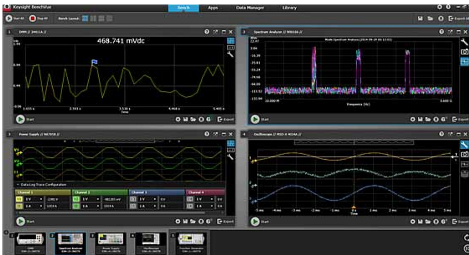
Рис. 4. Интерфейс программы BenchVue, соединенной с четырьмя приборами

Поскольку на выполнение одного из этих длительных испытаний может быть затрачено большое количество времени и труда, инженеры-программисты, разработавшие BenchVue, приложили множество усилий к тому, чтобы гарантировать долговременную стабильную работу программы. В версии 3.0 программы BenchVue появилась новая возможность — создание пользовательских циклов испытаний. Эта возможность реализована в программном модуле BenchVue Test Flow. Модуль Test Flow позволяет быстро и легко создавать простые автоматизированные испытания в программе BenchVue путем перетаскивания элементов управления приборами и их измерений.